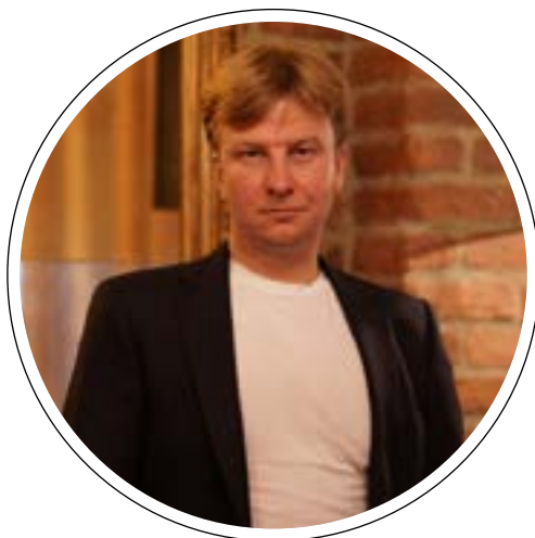
главный юрист компании РУСАЛ, специалист в сфере международных инвестиционных сделок, корпоративного управления, слияний и поглощений

А что происходит с профессиональной средой?